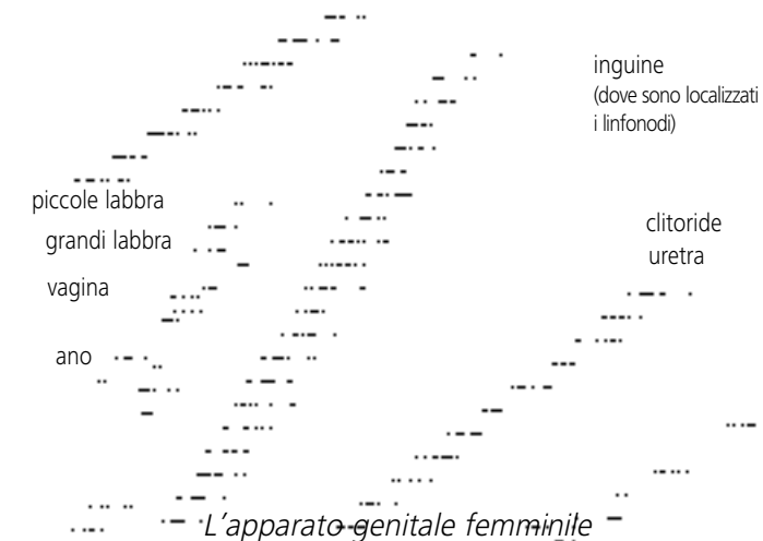
L'apparato genitale femminile

Clitoride: organo genitale femminile particolarmente sensibile, ricco di vasi e nervi.